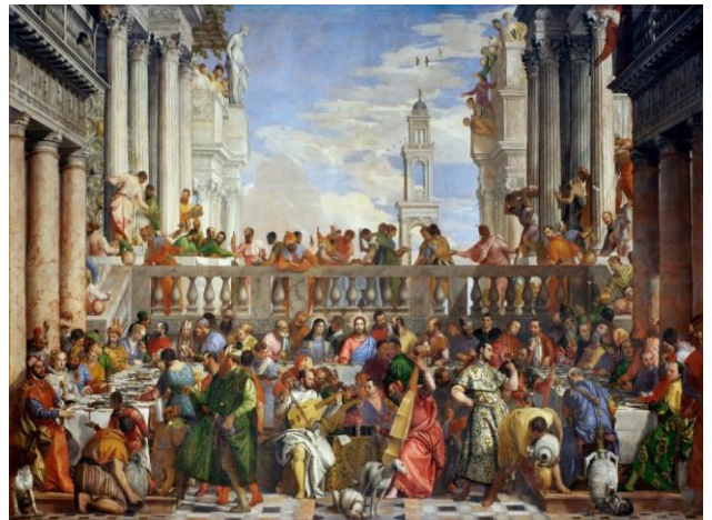
Las bodas de Caná; año 1553 [6.69mt x 9.90mt]